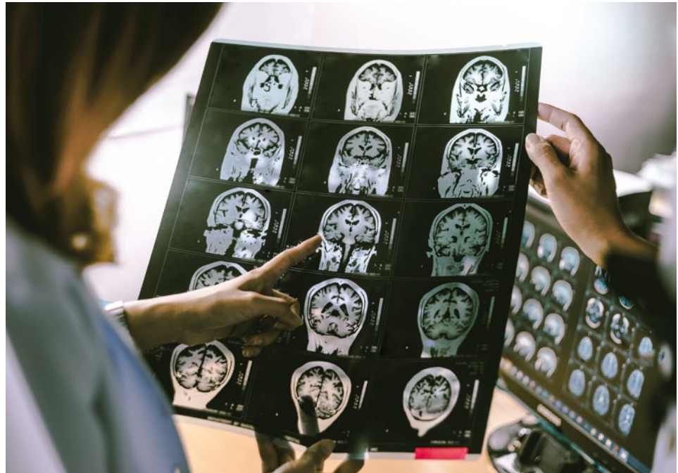
Abb. 3: Beispiel eines MRT vom Gehirn eines Demenz-Patienten.

Die Magnetresonanztomographie (MRT) wird häufig zur Darstellung von Gehirnatrophien (bei Alzheimer-Demenz insbesondere im medialen Temporallappen [25]) verwendet, während die craniale Computertomographie (cCT) Schlaganfälle oder andere Veränderungen identifizieren kann, die auf eine vaskuläre Demenz hinweisen könnten [26], z. B. disseminierte Mikro-Infarkte und White-Matter-Läsionen, wie die myelinisierten Bereiche im Gehirn als Zeichen einer Atrophie bezeichnet werden.