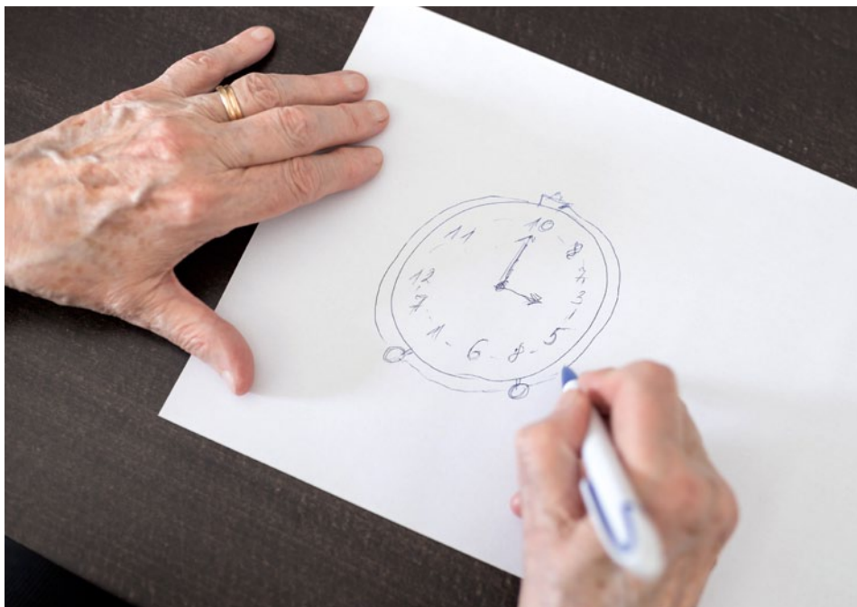
Abb. 2: Uhrentest bei Verdacht auf Demenz-Erkrankungen

Zu den kognitiven Tests gehören MMST, DemTect und der Uhren-Test nach Shulman.